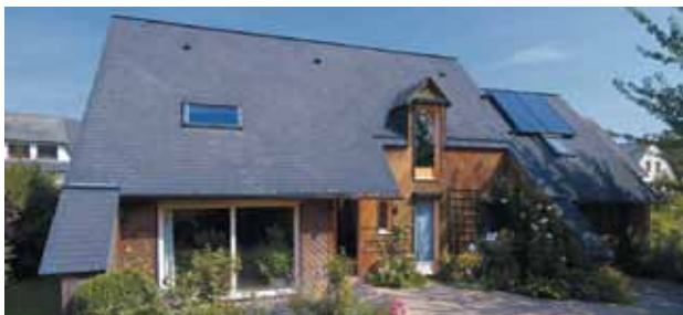
L'isolation du toit est essentielle car 25 à 30 % de la chaleur s'échappe par la toiture.

** pour ces travaux portant sur des éléments multiples, la dépense doit porter sur une partie significative du logement, voir pages 17 et 18.