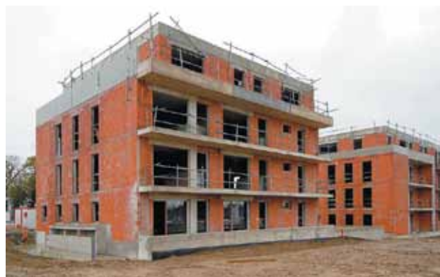
En 2013, les aides financières encouragent la construction de logements très économes en énergie.

Le prêt à taux zéro+ est réservé aux logements respectant la réglementation thermique 2012 ou dont le niveau de performance énergétique est certifié par l'obtention du label « bâtiment basse consommation, BBC 2005 ».