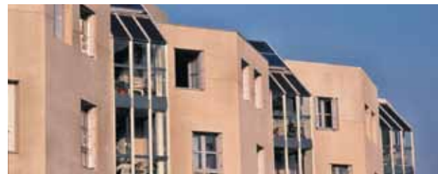
Propriétaires, bailleurs, locataires en habitat collectif peuvent bénéficier du crédit d'impôt.

les gros appareillages de chauffage collectif des immeubles et ceux permettant la régulation, la programmation du chauffage, le comptage individuel et la répartition des frais de chauffage (voir p. 12-13) peuvent bénéficier du crédit d'impôt .